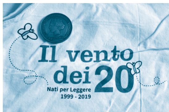
Medaglia del Presidente della Repubblica, 24-09-2019.

Un pediatra che aderisce a NpL è formato alla promozione della lettura nella pratica clinica quotidiana, con il valore aggiunto della forte autorevolezza esercitabile sulle famiglie. Consiglia libri, informa e "forma" i genitori sull'importanza di questa buona pratica, per quanto riguarda i benefici sullo sviluppo cognitivo, emotivo e relazionale del bambino.